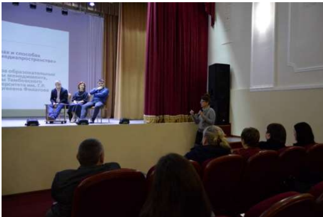
Круглый стол «Фестивальное движение в Тамбовской области: перспективы, проблемы и пути их решения», 08.11.2019, представители муниципальных образований активно делились собственным опытом проведения фестивалей