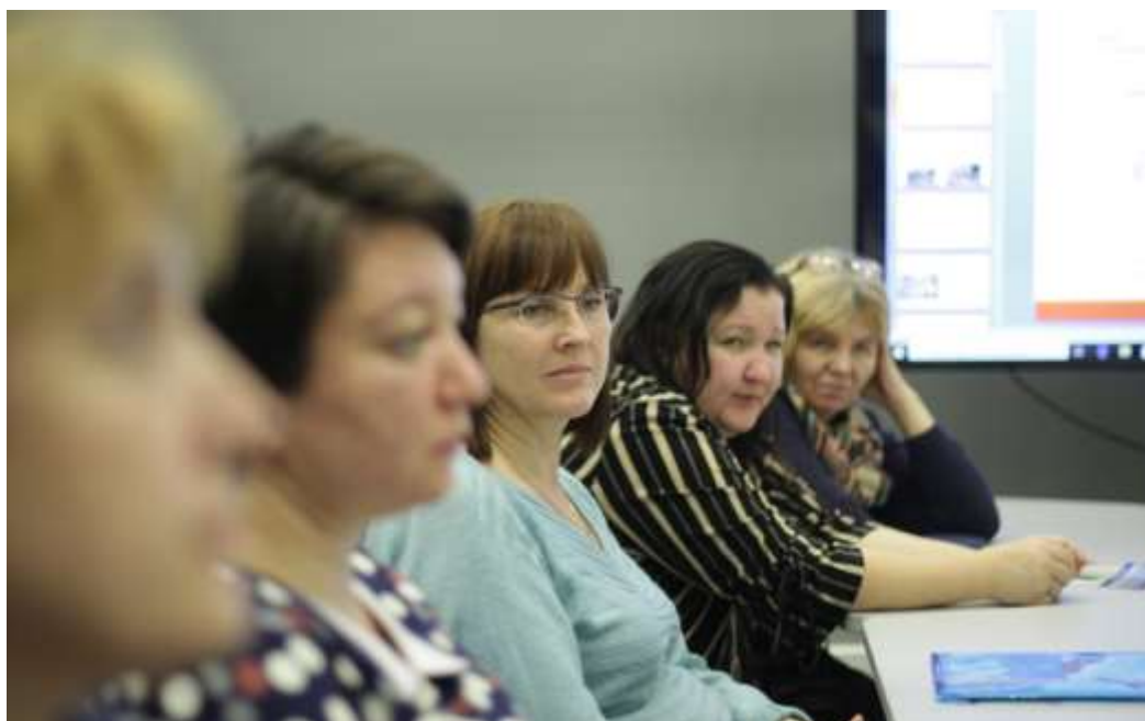
Практикум «Дизайн пространства некоммерческой организации», 25.12.2019, практикум состоялся в технопарке «Державинский»