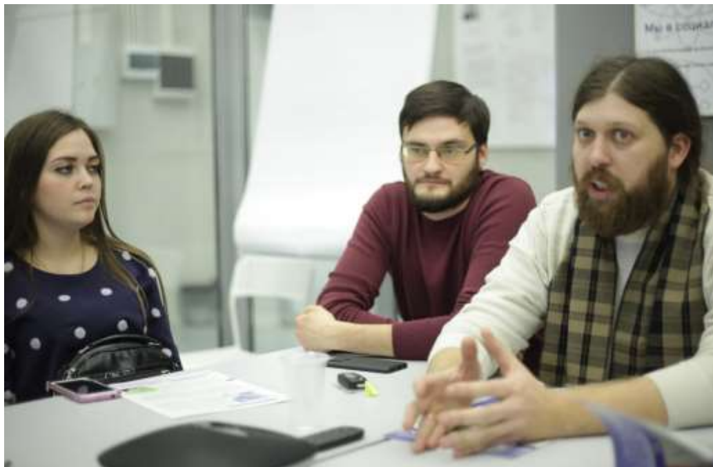
Практикум «Дизайн пространства некоммерческой организации», 25.12.2019, директор Центра изобразительного искусства «Арт-Лаборатория» рассказывает участникам практикума о дизайне в деятельности НКО