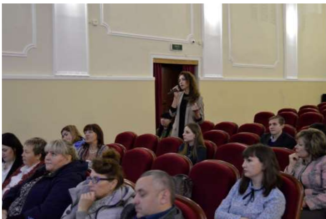
Круглый стол «Фестивальное движение в Тамбовской области: перспективы, проблемы и пути их решения», 08.11.2019, представители некоммерческих организаций задавали вопросы и активно обсуждали перспективы привлечения грантовых средств Фонда –оператора президентских грантов для организации культурных массовых мероприятий региона